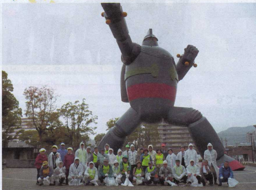
平成23年11月11日(金)神戸マラソン「クリーンアップ作戦」