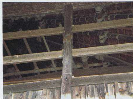
天井の構造が美しい幾何文様です

江戸時代、幕府によって抑圧された農民、庶民の数少ない娯楽の一つが芝居見物であった。地方廻りの役者或いは村の若者が演じる田舎芝居、田舎歌舞伎の舞台になったのがいわゆる農村歌舞伎舞台である。北区下谷上の天彦根神社境内にあるこの舞台は、多くの特色を持ち歴史的価値も高く、全国屈指の農村歌舞伎舞台として国の重要有形民俗文化財に指定されている。天保十一年(1840)に建築されたもので、規模が大きく(間口12メートル、奥行8メートル)、花道や回り舞台、反り橋(花道を裏返すと半円形の橋になる、全国唯一のもの)などの本格的な装置を有し、全国に現存するおよそ千棟の農村舞台装置の中で五本の指に入るほど古い。(但し、現在の建物自体は昭和54年に再建されたものです)