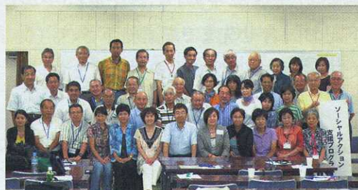
1学期受講生の集合写真