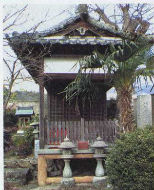
弁財天の社、下部に池がある