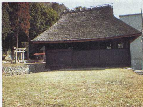
正面写真、手前が観客席になる