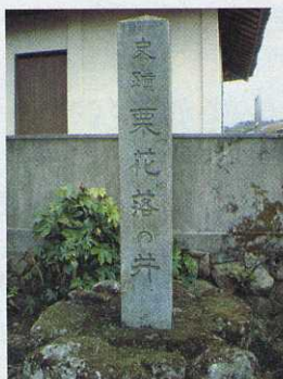
栗花落の井の石碑