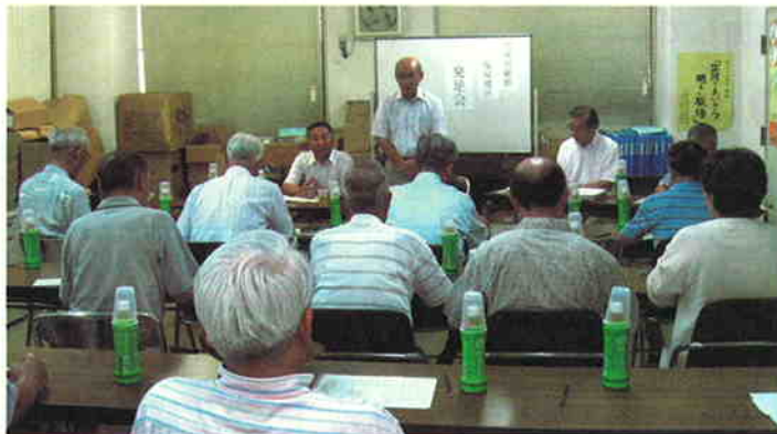
西部センターでの発足式

地区内の24名の会員が、広報グループ・技術グループ・サービスグループの3つのグループに別れ、地区内のご家庭での困りごとの援助を中心に活動を行っていきます。