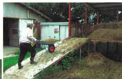
西区の乗馬クラブ