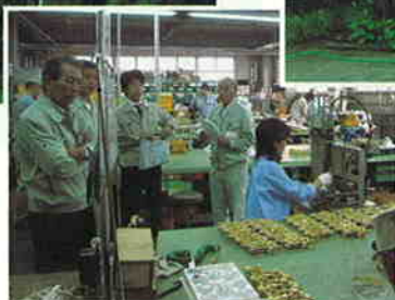
長田区の部品工場