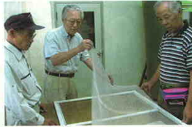
網戸の貼替えの実習