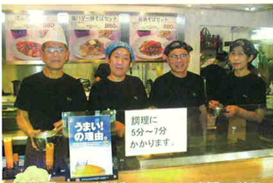
長井オーナー(左から2人目)と就業会員のみなさん

長井オーナーは、「決して手を抜かず美味しいものをお客さんに食べて頂きたいから、安易な方法に走ったり、安いだけの材料を使うことはやりたくない。」とおっしゃっていました。だから例えば「むきエビ」。「やっぱり生エビが一番でしょう！冷凍むきエビは使わず一尾ずつ殻をむいて使います。」と。「また、作り置きはしないからどうしても5分や6分かかってしまう。でも気持ちは一秒でも早くお客さんに渡したいと願いながらやっています。」ともおっしゃっています。